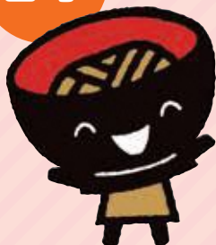
岩手県PRキャラクター わんこぎょうだい・そばっち