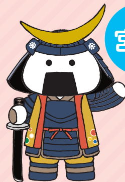
仙台・宮城観光PRキャラクター 「むすび丸」