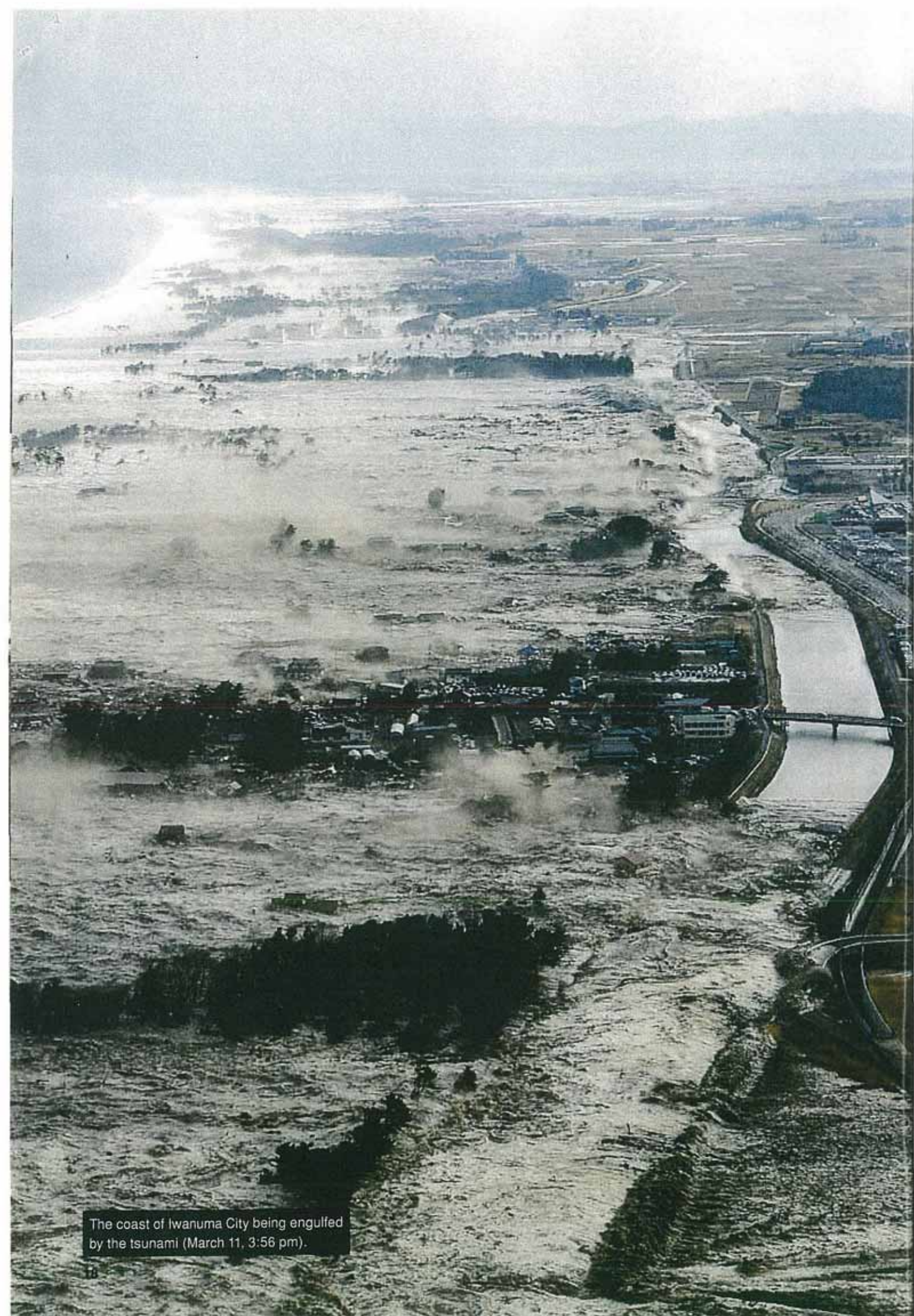
The coast of Iwanuma City being engulfed by the tsunami (March 11, 3:56 pm).