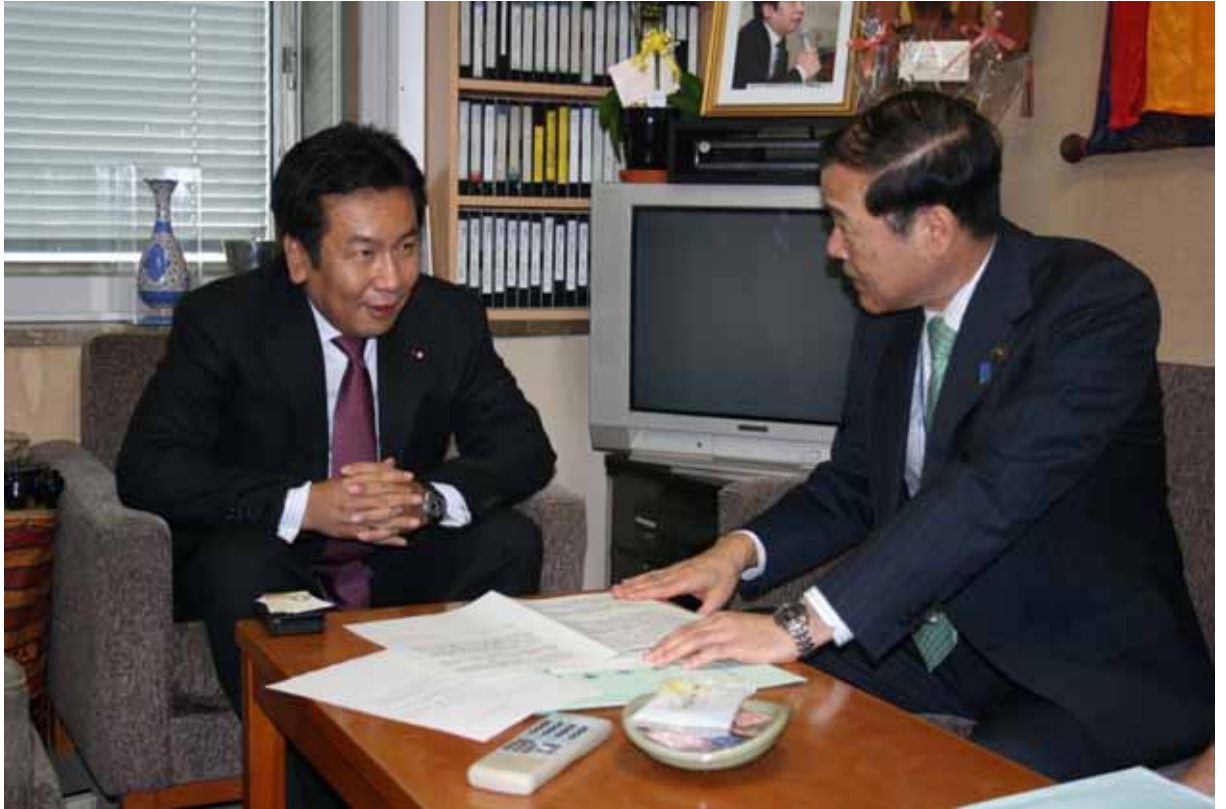
枝野幸男衆議院議員（行政刷新会議「事業仕分け」統括役）に要請する森会長